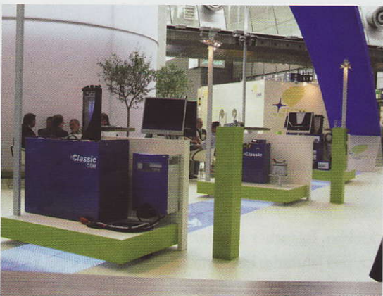
3D-Animationen unterstützen die Exponatpräsentation